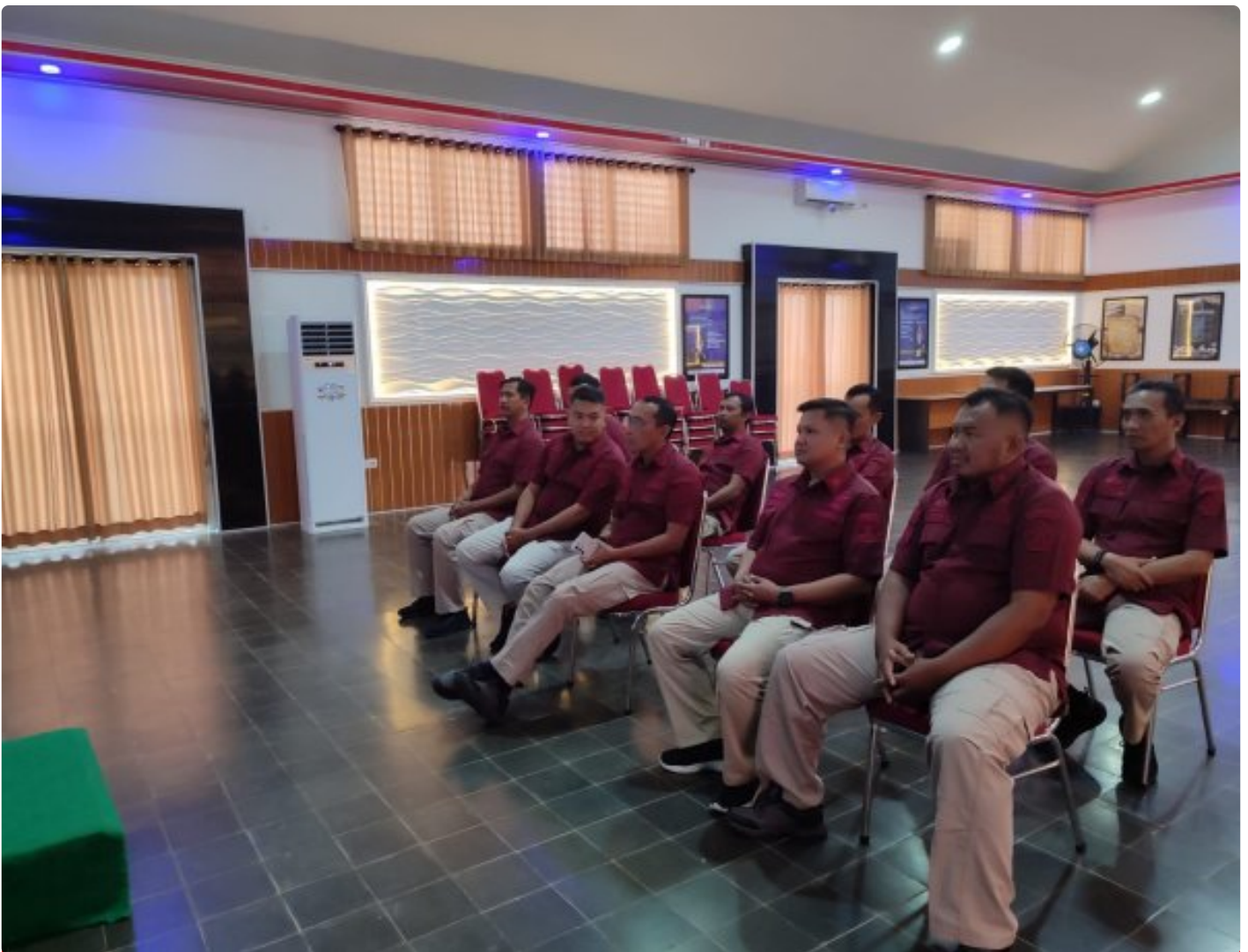
Bangun Personal Branding ASN, Lapas Besi Hadiri Webinar Series 6

CILACAP – Petugas Lapas Kelas IIA Besi Nusakambangan menghadiri kegiatan Webinar Series 6 yang diselenggarakan oleh Badan Pengembangan Sumber Daya Hukum (BPSDM) dan HAM bertempat di Aula Wijaya Kusuma, Kamis (24/10/2024).